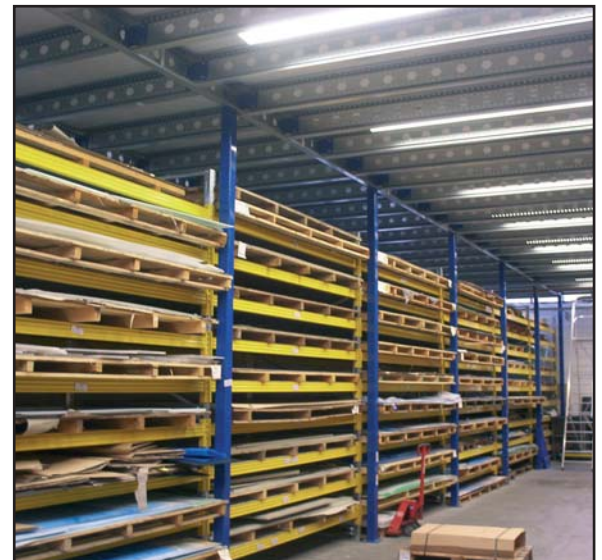
Pfostensetzung abgestimmt auf Betriebsabläufe