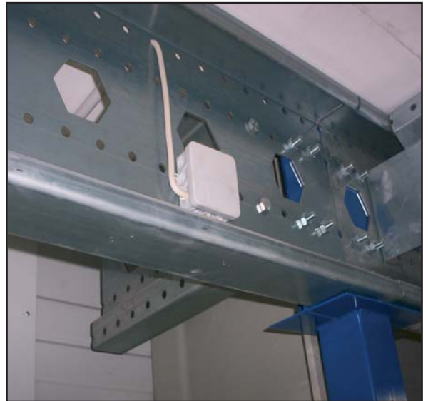
Systemlochung optimal für Befestigungstechnik, Elektrifizierung, Beleuchtung, Sprinkleranlagen,... Einbau einer Hallenstütze (Bühne bis zur Wand)