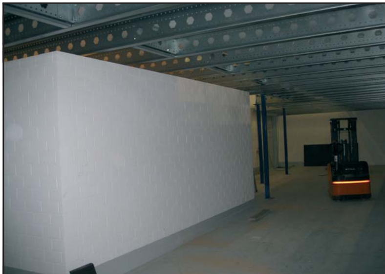
Große Spannweiten sind möglich (bis 8 Meter)