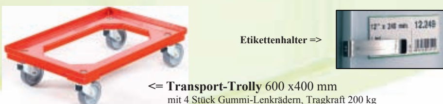
Transport-Trolley 600 x 400 mm mit 4 Stück Gummi-Lenkrädern, Tragkraft 200 kg